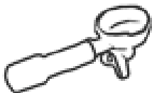
páka na přípravu kávy